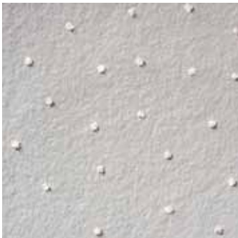
5901 WHITE BLING