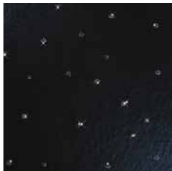
5904 BLACK BLING