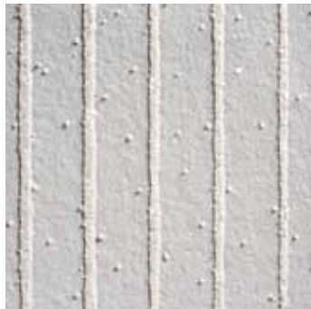
5902 WHITE RAY