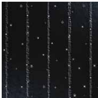
5905 BLACK RAY